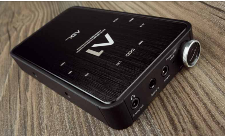
Kleine Leuchten auf der Oberseite zeigen die verwendete Samplingrate an. Zum Schutz sind die Kanten des Gerätes mit Gummi bezogen