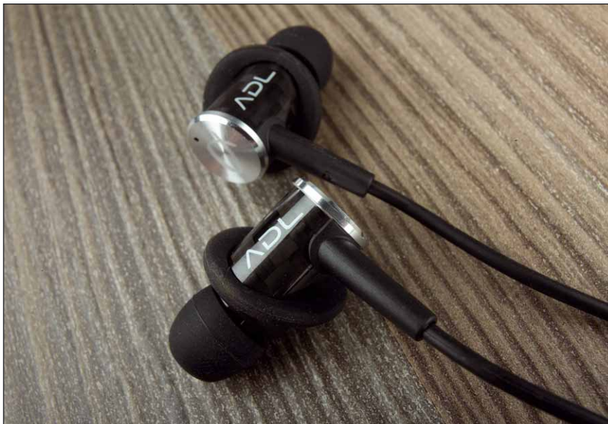
Carbon und Aluminium umschließen die beiden Treiber der EH008 Ohrhörer