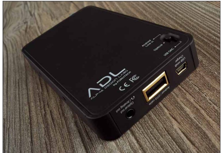
Mit dem Schalter an der Unterseite wird der Nutzungsmodus geändert. Android On-the-Go, USB, oder optisch

wird auch gleich ein solider Gummiring, mit dem man das Quellgerät und den ADL A1 zusammenschließen kann. Leider wird dabei der Bildschirm des Telefons teilweise verdeckt, was Eingaben mit dem Touchpad erschwert. Der A1 hingegen lässt sich zu jeder Zeit hervorragend bedienen. Ein griffiger Drehregler dient einerseits zum Ein- und Ausschalten, andererseits zum Einstellen der Lautstärke des portablen Verstärkers. Eine direkt daneben befindliche kleine LED informiert außerdem über den Ladezustand des A1. Bei vollem Akku und je nach Benutzung sollte der Kleine so bis zu siebeneinhalb Stunden Musikbetrieb aushalten, ohne dass dabei Energie vom angeschlossenen Player oder Smartphone abgezogen wird. Über einen Mangel an Anschlussmöglichkeiten braucht man sich beim A1 ebenfalls nicht zu beschweren: Zwischen Drehregler und Kopfhörer-Anschluss befinden sich sowohl eine Buchse für Line-in wie auch eine zur Verbindung über ein optisches Kabel. An der gegenüberliegenden Seite können USB-Verbindungen mit einem Mini-Stecker oder dem klassischen USB-A hergestellt werden. Dazu kommt eine Kombination aus Klinke und optischem Ausgang. Der große USB-Eingang hält außerdem eine Besonderheit bereit: Er ist für Androids On-the-go-Kabel aus-